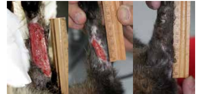
Diabetischer Kater mit chronischer Wunde am Vorderlauf nach erfolgloser Hauttransplantation. Heilungsverlauf über 14 Wochen (2 Behandlungen/Woche); Dr. C. Bender, Kleintierpraxen Karrin & Lubmin